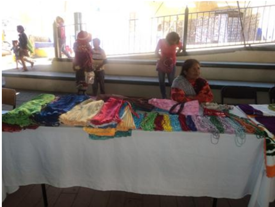
FIGURA 2. Mujer mazahua vendiendo sus productos hechos a mano