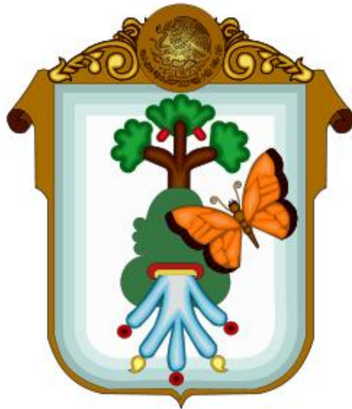
FIGURA 25. Secuencia y colores del escudo municipal

del cerro o montaña se encuentra representado un manantial, mismo que muestra un glifo caracterizado por cinco brazos, simbolismo que expresa agua fluyendo. Por su parte, la aparición de la mariposa monarca –colocada de tal forma que ocupa un lugar preponderante– tiene una inclinación, lo que representa su vuelo de migración en la zona. Como dato adicional se menciona que se ubica hacia el lado derecho debido a su pertenencia al Estado de México. En cuanto a los colores, estos son representativos de cada elemento: el cerro o montaña mediante el verde esmeralda; bosque, hoja verde; agua, blanco y, finalmente, la mariposa por medio del naranja.