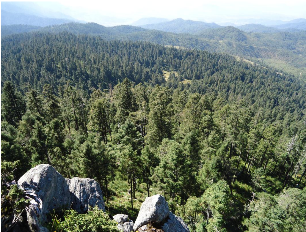
IMAGEN 7. Geomorfología de San José del Rincón

A continuación se muestra información respecto al eje volcánico que conforma el subsuelo del municipio: San José se encuentra dentro del eje volcánico que va desde Nayarit hasta Veracruz, en el cual encontramos a varios de los volcanes más representativos de México, como lo es el pico de Orizaba y Popocatepetl, por mencionar algunos, [...] 42 Por otro lado, el territorio municipal a su vez se encuentra dividido en dos partes por las dos siguientes provincias fisiográficas, al Oeste la provincia Mil cumbres, con elevaciones importantes como los cerros de El Cabrero, El Cedral, El Ochcon, El Picacho, La Corona, La Espanta Vaca, Las Cebollas, Las Peñas, Loma Pelada, Silgüero. 43