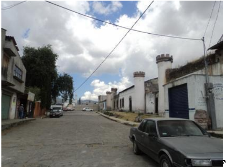
FIGURA 15. Fachada de la Hacienda La Providencia

Como símbolo de la arquitectura típica del municipio permanecen los cascos de las haciendas de San Onofre, La Providencia, San José, La Trinidad y la Purísima. Puede decirse que en gran medida representa el pasado cultural del municipio.