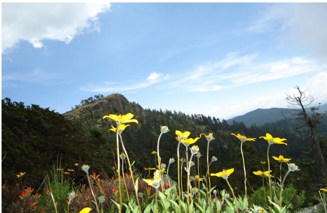
FIGURA 10. Reserva de la Mariposa Monarca

Forestalmente hablando la entidad en cuestión cuenta con una superficie de 20,000 hectáreas, de las cuales aproximadamente 5,000 corresponden a la biosfera de la mariposa monarca. La región sobre la que se sitúa el municipio se caracteriza por su riqueza natural. En cuanto a flora se refiere, en la zona que corresponde a bosques –propias del Estado de Michoacán– se encuentra el árbol de oyamel mezclado con pino. En el resto de los bosques el pino se mezcla con el árbol de encino. Además de estas variedades de árboles es posible identificar eucalipto, fresno y sauce. En lo que se refiere a árboles frutales el clima de la región permite la proliferación de capulín, chabacano, ciruelo, durazno, higo, manzana, pera y tejocote. Entre las plantas medicinales que se dan en la región se encuentra el árnica, caballo, hierba de burro, hierbabuena, inisilla y uña de gato entre otras. Dentro del grupo de plantas comestibles se encuentra el aromado, cenizo, chivito, nabo, quelite, quintonil, romero y sanrejé.