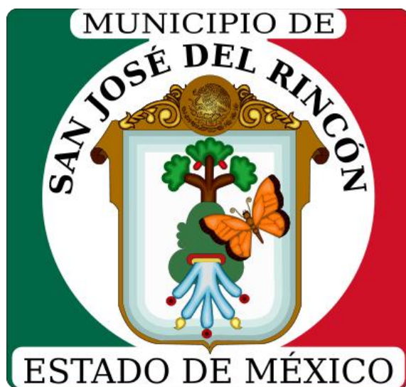
FIGURA 24. Elementos que constituyen el Escudo del Municipio de San José del Rincón