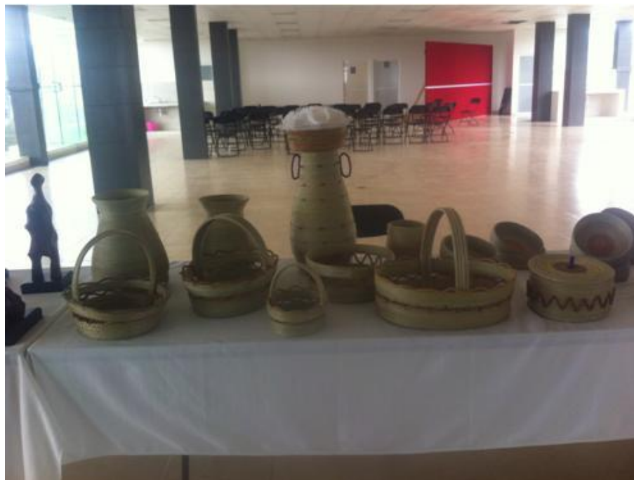
FIGURA 18. Canastas hechas a mano por mazahuas