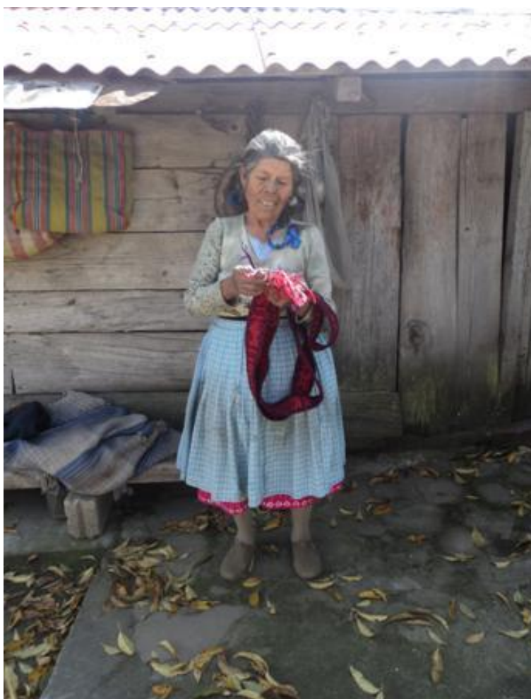
FIGURA 16. Mujer mazahua tejiendo frente a su casa

Las artesanías del Municipio son un ejemplo de la sensibilidad de sus habitantes. Cada localidad tiene un producto único, el cual forma parte de nuestro tesoro, hecho con gran derroche de creatividad, formas y colores como se puede apreciar en los bordados mazahuas, textiles deshilados y tejidos en telares como fajas de Jaltepec o San Antonio Pueblo Nuevo, así como los gabanes de Trampa Grande, cestos de oxocal u hoja de zacatón y artesanías en madera; la mayoría de estas artesanías tienen origen en técnicas prehispánicas. 74