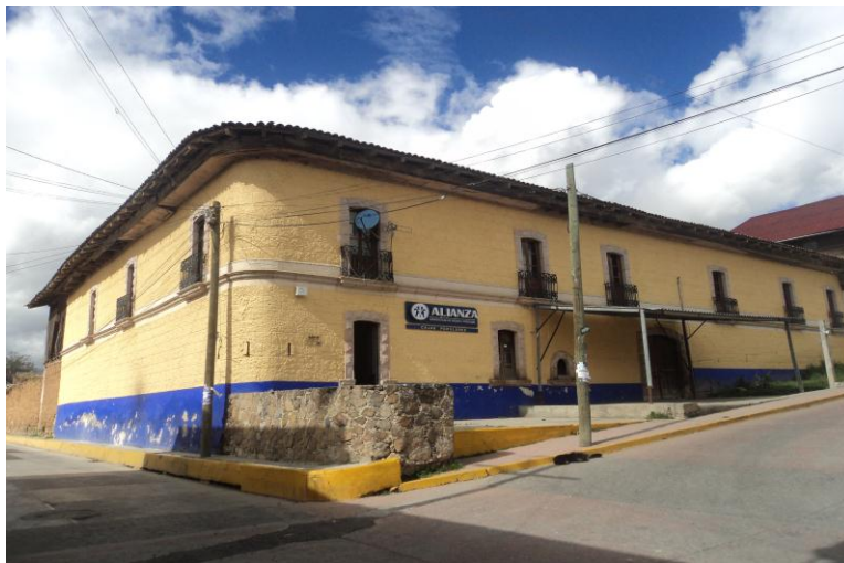
FIGURA 23. Fachada de Hacienda de San José

Denominada en algún momento el Rincón de Mayorazgo de Cuevas, derivó en la hacienda del Rincón, posteriormente se llamó de San José del Rincón y hoy en día es la Cabecera Municipal de San José del Rincón. A pesar de no contarse con una fecha exacta de su fundación se considera al año de 1880 como primordial para entender el desarrollo que ha tenido como proyección comercial y cultural para el municipio. En dicho año esta hacienda se encontraba rodeada de bosque y su territorio abarcaba lo que ahora es la cabecera municipal y sus alrededores [...] Entre sus principales actividades destacaban la agricultura, con siembra de maíz, trigo y cebada; la ganadería con la producción de ganado vacuno, equino, ovino, asnal, porcino y otros; y además el traslado de madera a la Mina Dos Estrellas. 76 Desafortunadamente en la actualidad sólo sobrevive la Casa Principal, misma que es propiedad de la cuarta generación de la familia Marín. Importante mencionar que dicha familia donó diversas partes de la hacienda para construir lo que hoy en día es la primaria y la iglesia central así como la plazuela de San José del Rincón, el centro de salud y diversos lugares céntricos.