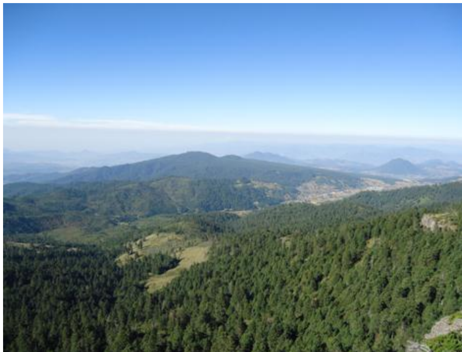
FIGURA 5. Mirador Picachito

En su superficie territorial predominan sierras, lomas y valles. Los principales cerros alcanzan un promedio de 3,000 metros sobre el nivel del mar. Sobresalen en la parte sur del municipio el Cerro de las Cebollas (3,060 msnm) y el Cerro Cabrero (3,260 msnm); en el lado este del municipio se encuentra el cerro de Jaltepec (2,960 msnm); en el noroeste se ubica el Cerro Silguero (3,160 msnm); y en el norte el Cerro El Cedral (3,000 msnm). 37