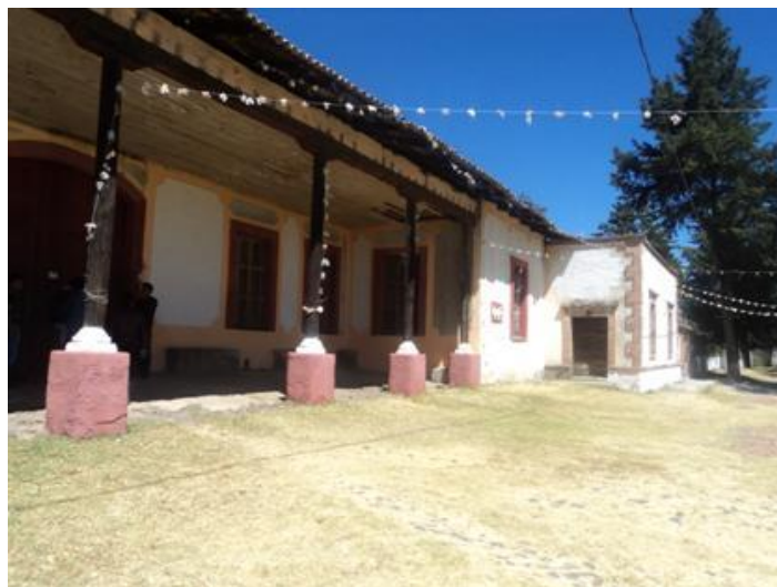
IMAGEN 20. Fachada de la Hacienda de San Onofre

La hacienda contaba con luz, teléfono, correos, botica, sala de cine, salón de bailes, biblioteca particular, sala de arte (tipo museo), 2 albercas, sala de juegos, frontón y cancha de tenis. Cada año los hacendados construían lienzos, casas para palenque, rodeos y jaripeos. Suele comentarse que sus últimos dueños se mudaron al D.F., dejando a su cargo de la hacienda sólo a encargados, los cuales –a decir de la gente del lugar–, fueron los responsables de dismantelar paulatinamente la hacienda hasta dejarla en ruinas.