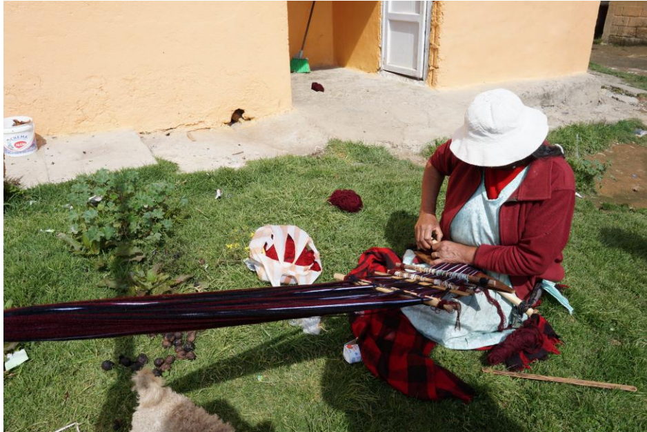
FIGURA 17. Mujer tejiendo un Chal o Rebozo.