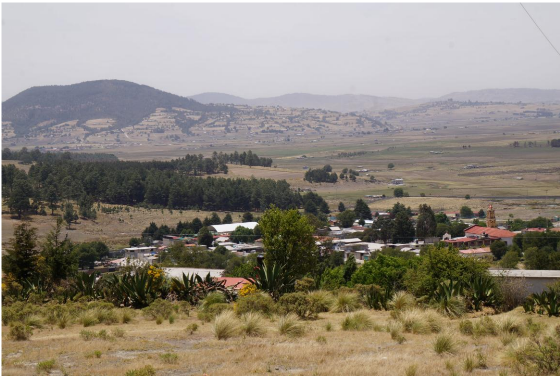
FIGURA 6. Suelo característico de San José del Rincón

Por otra parte, existen numerosas fracturas, principalmente en las zonas boscosas de las sierras, así como dos fallas geológicas, ambas ubicadas al norte del municipio. Una se encuentra en la parte sureste de la comunidad de San Miguel del Centro y otra en las cercanías de San Jerónimo Pilitas y Guarda de la Lagunita, además de existir cinco aparatos volcánicos, dos de los cuales se encuentran en las proximidades de dichas fallas. 39