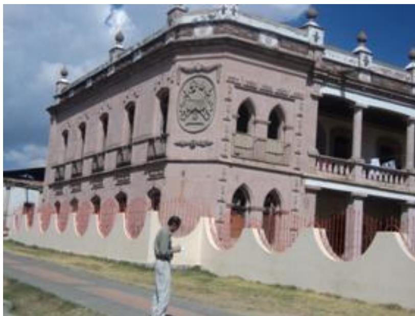
FIGURA 22. Parte de la fachada de la Hacienda Tierra Quemada, ahora conocida como La Providencia

El año de 1750 suele referirse como el año en el cual esta hacienda comenzó a construirse. Sin embargo, la fecha que sobresale en este recuento es la de 1895, que es cuando el español Juan de la Fuente Parres, compró [esta hacienda], e introdujo el sistema de producción a destajo, o sea por el que hiciera el peón, 75 cambiando también su nombre por el de La Providencia. Ambos aspectos se relacionan con el hecho de que dicho inmueble comenzó a considerarse cada vez como más próspera a finales del siglo XIX y principios del XX, con fecha aproximada de 1895 y 1896. Se trata de una hacienda zacatonera de gran éxito debido a su forma de manejar el destajo: un peón con su palanca, su burro, el morral con sus gorditas, huaraches de llanta y correas, camisa y pantalón de manta, con su garrote para paliar la raíz del zacatón que arrancaba de la tierra y poder lavarla en el río, entregando el producto de su jornada a la tienda de raya donde era pesado para pagarle según el kilo de raíz que hubiese sacado y limpiado.