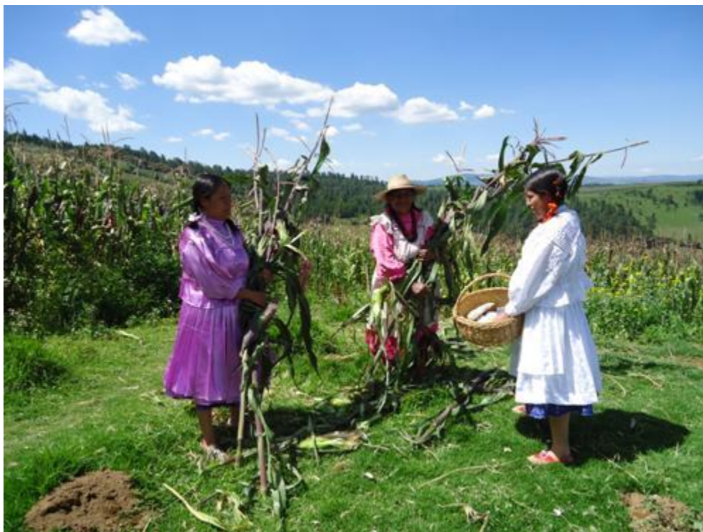
FIGURA 8. Mujeres mazahuas cosechando maíz