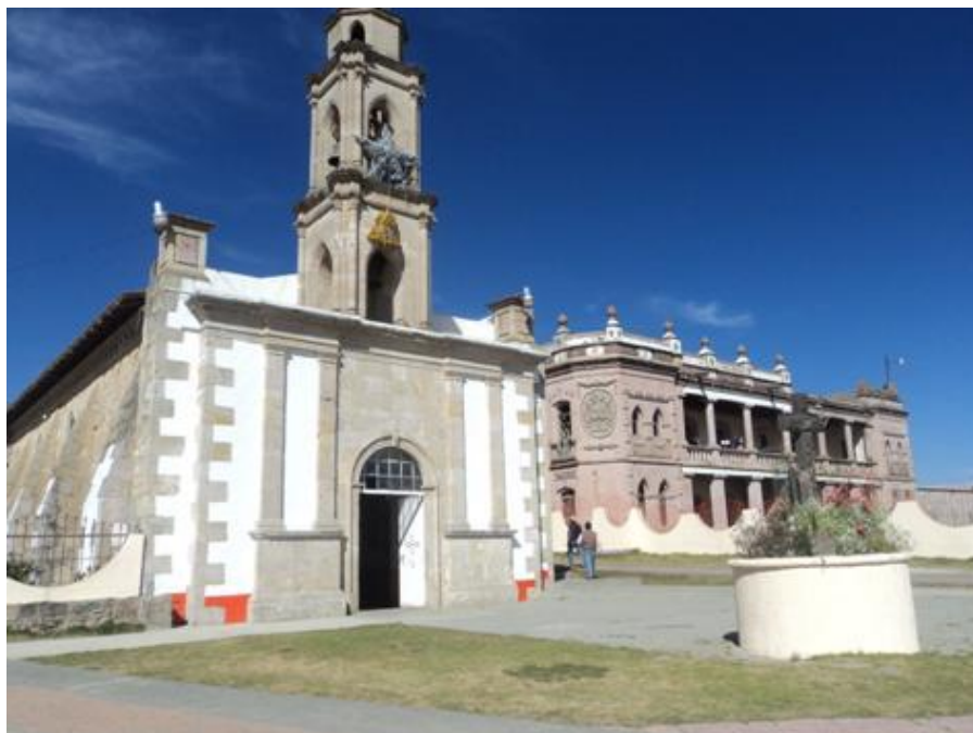
FIGURA 23. Parroquia de la Hacienda La Providencia