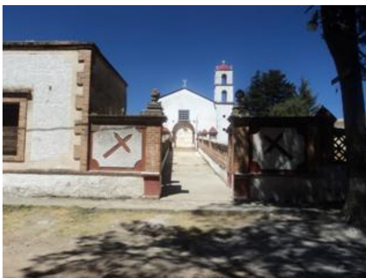
FIGURA 21. Entrada a la Capilla de la Hacienda San Onofre

La hacienda contaba con luz, teléfono, correos, botica, sala de cine, salón de bailes, biblioteca particular, sala de arte (tipo museo), 2 albercas, sala de juegos, frontón y cancha de tenis. Cada año los hacendados construían lienzos, casas para palenque, rodeos y jaripeos. Suele comentarse que sus últimos dueños se mudaron al D.F., dejando a su cargo de la hacienda sólo a encargados, los cuales –a decir de la gente del lugar–, fueron los responsables de dismantelar paulatinamente la hacienda hasta dejarla en ruinas.