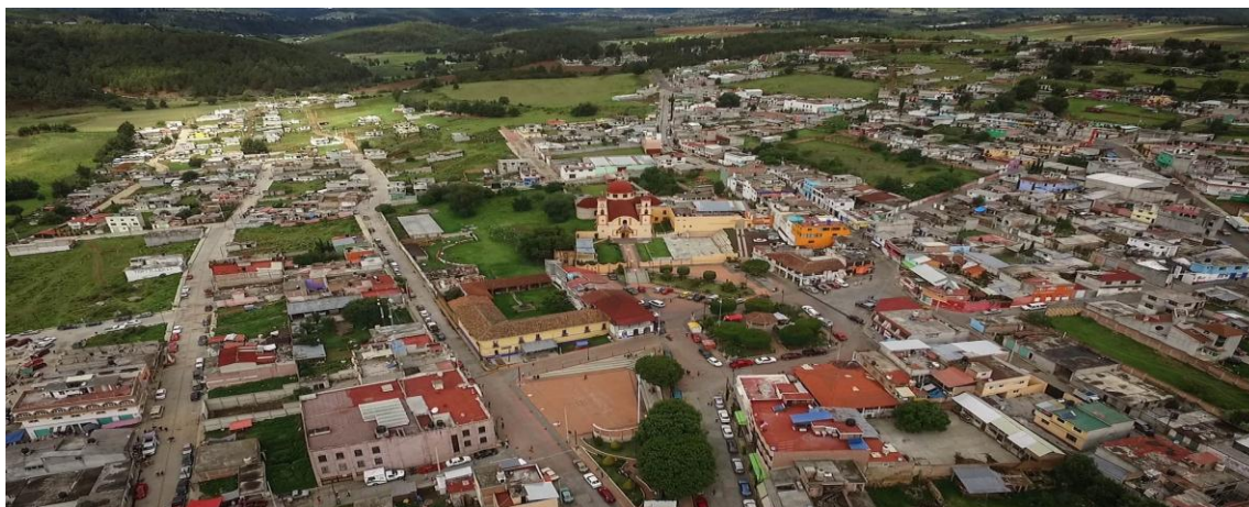
FIGURA 4. San José del Rincón