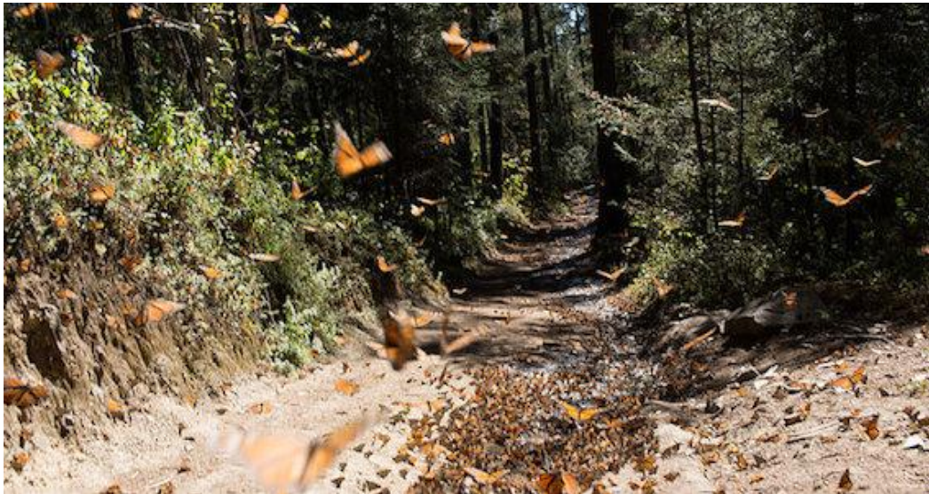
FIGURA 13. Santuario de la Mariposa Monarca

La metamorfosis de la monarca abarca 4 etapas diferentes: hubo, gusano o larva, crisálida o capullo y mariposa. Esta variable de la Danaide va adheriendo uno a uno sus huevecillos, con una sustancia que ella misma produce en el envés de la asclepia, son de forma ovalada y con un agujerito llamado micrópilo, por donde respira y por donde fue fecundado. El gusano o larva producirá seda, y se verá hinchado como un globo, por la hemolinfa, cambia la bolsa o piel 5 veces, devora las hojas de la asclepia y hasta la misma piel hasta hacerse cada vez más grande; crisálida, ni oruga ni mariposa, poco a poco al seda que como red la envuelve hasta la metamorfosis total en mariposa. 63