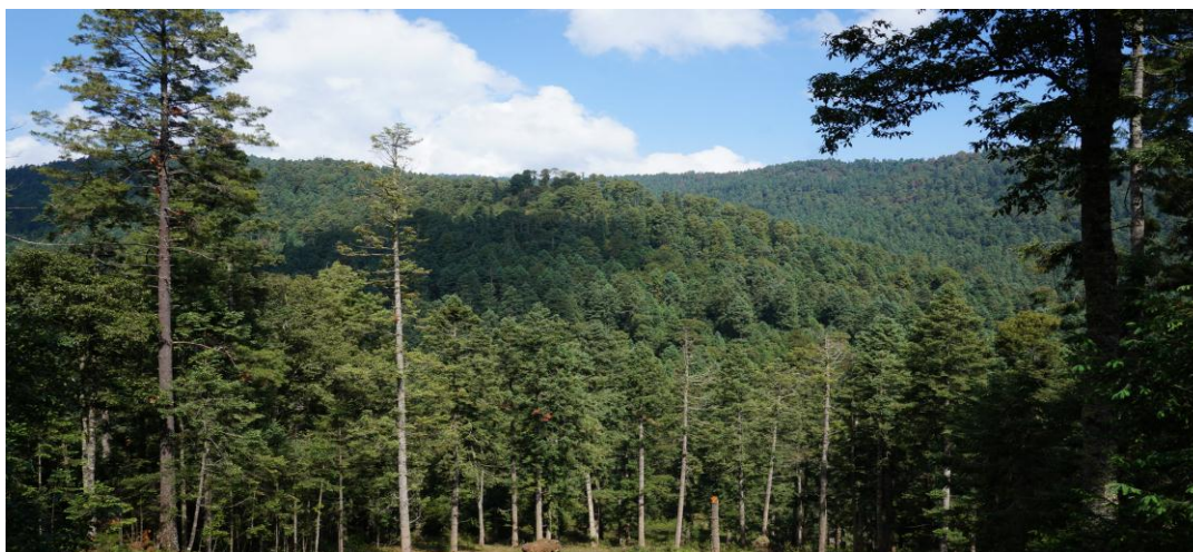
FIGURA 14. Zona protegida para la Mariposa Monarca

una superficie de 16,309 hectáreas y es parte de un importante patrimonio histórico y cultural. Por la riqueza natural del bosque de San José del Rincón, la mariposa monarca arriba a los parajes denominados ejidos “La Mesa” y “Palo Amarillo” en la Sierra Chincua. 64 Una característica de esta zona es la biodiversidad que representa, situación que hace necesaria su constante vigilancia así como el cuidado permanente debido a que se trata de espacios con gran afluencia turística pero, además, por tratarse de una gran herencia natural que otorga identidad al municipio. Los tipos de vegetación presentes son los siguientes: el Bosque de Oyamel ( Abies religiosa ), el Bosque de Pino ( Pinus spp ), el Bosque de Encino ( Quercus laurina ) y el Bosque de Cedro ( Cupressus lindley ), así mismo, el área cuenta con una singular relevancia faunística, teniendo registradas ciento ochenta y cuatro especies de vertebrados de los cuales cuatro son anfibios, seis reptiles, ciento dieciocho aves y cincuenta y seis mamíferos. 65