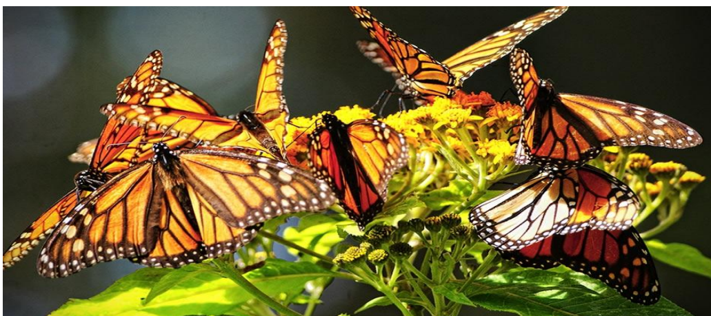
FIGURA 12. Mariposa Monarca

[...] llega en forma selecta a las cumbres de Angangueo en el eje volcánico, en el centro sur de la República Mexicana, entre los estados de México y Michoacán. Municipios de Ocampo y Angangueo en Michoacán, y Villa de Allende y San José del Rincón, en el Estado de México; permanecen aquí desde noviembre hasta abril. Los insectos, aparecen hace 345 millones de años, junto con ellos las mariposas, desde entonces la Monarca va y viene entre Canadá y México. Llega a los alrededores de la zona minera, atraída por un foco magnético que como faro la orienta. 61