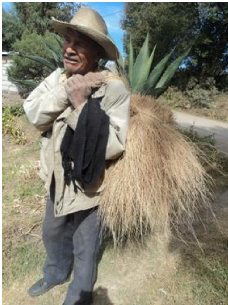
FIGURA 9. Anciano mazahua cargando raíz de zacatón

Como dato relevante al respecto, la semilla de este producto fue obsequiada a toda la región sur del municipio de San Felipe del Progreso, Villa Victoria, San José Malacatepec, El Salitre y Valle de Bravo con lo cual ha sido abarcada toda la zona aledaña al municipio, abarcando incluso hasta las inmediaciones del volcán de Toluca. Este producto se industrializó precisamente en la hacienda Providencia y sirvió de base para fomentarlo en los municipios y comunidades no solamente del Estado de México, sino de Morelos, Hidalgo, Tlaxcala, Puebla, Veracruz, Michoacán, Jalisco así como en gran parte de Colima, situación que dio lugar a que se conociera con el nombre de “raíz de zacatón” en Europa exportándola desde el año 1892.