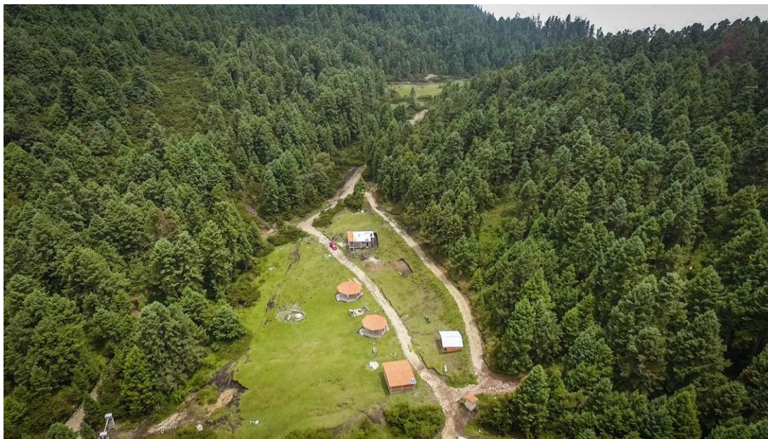
FIGURA 11. Cabañas del Ejido La Mesa

A su vez –con el objeto de hibernar– arriba a los bosques de este municipio provenientes de Canadá y Alaska la mariposa monarca. Como parte del área protegida para esta especie se comprende una superficie de 16,309 hectáreas donde hiberna de noviembre a marzo. Por la riqueza natural del bosque de San José del Rincón este tipo de mariposa arriba a los parajes denominados Ejido La Mesa y Palo Amarillo en la Sierra Chincua. El hábitat de la mariposa monarca es respetado por los habitantes así como por los turistas que visitan la región.