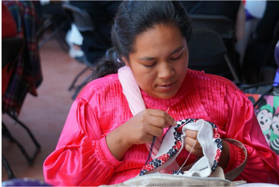
FIGURA 1. Mujer mazahua Bordando artesanías