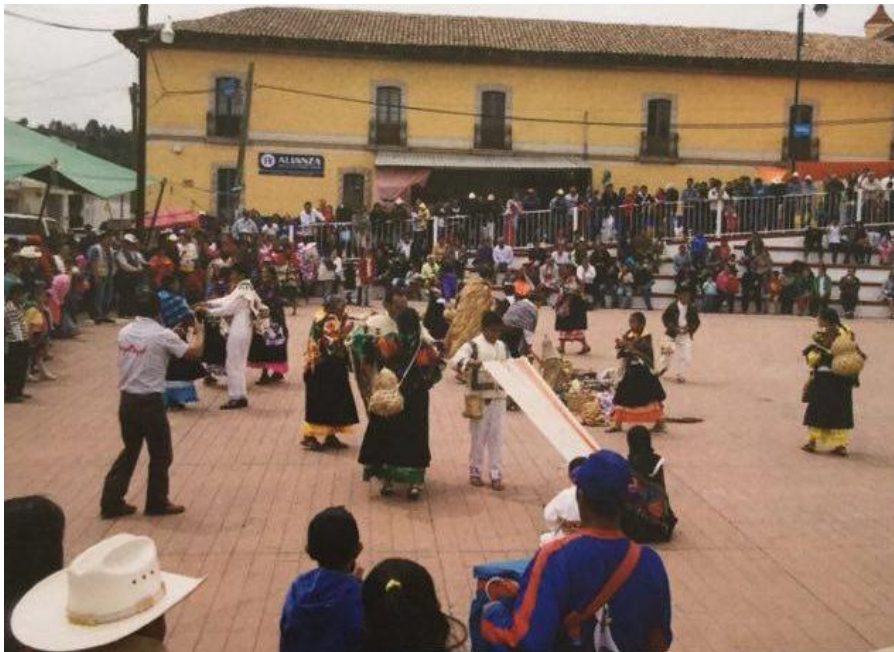
FIGURA 15. Ancianos y jóvenes mazahuas danzando

Las danzas recrean el simbolismo del grupo étnico mazahua, siendo una tradición en la cual convergen sus creencias, las pastoras, bailes propiamente mazahuas, santiagoneros, Danza de los apaches y Danza de los toritos. Todas representan la búsqueda del equilibrio y armonía entre la población y la naturaleza. Sumadas a ellas se encuentran las que ya se han comentado: la Danza de Pastoras, Danza de Santiagueros y la Danza de los Concheros.